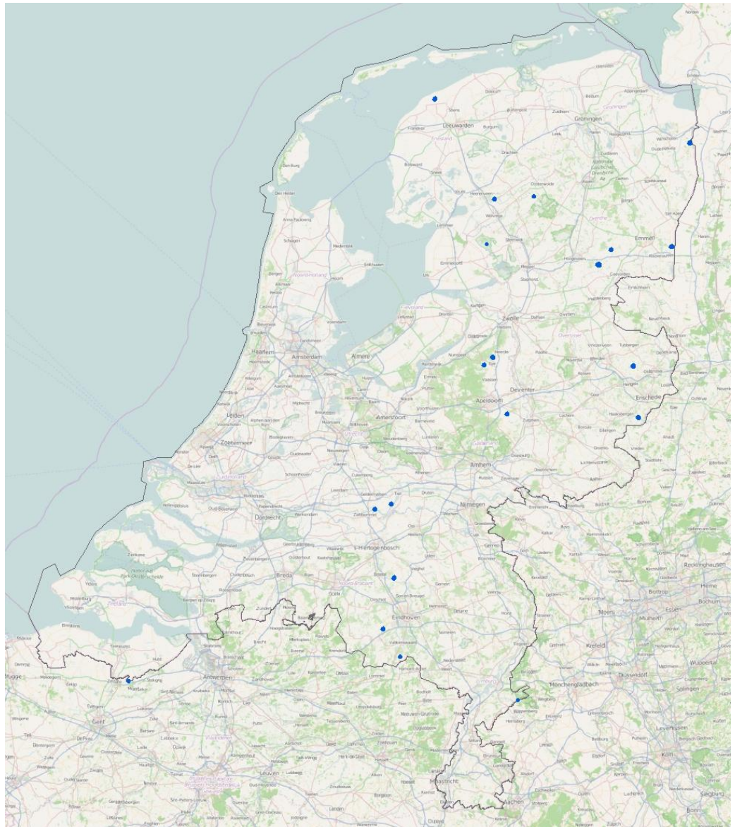
Afbeelding 2: Bevolkingskernen in Nederland waar de verbingswaarschijnlijkheid met de 1-1-2 Alarmcentrale lager is dan 99%.

Het CBS hanteert voor het begrip bevolkingskern de uitleg 'aaneengesloten bebouwing, meer dan 50 inwoners.'