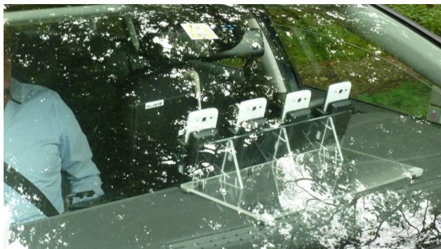
Afbeelding 4: Meetopstelling validatiemetingen