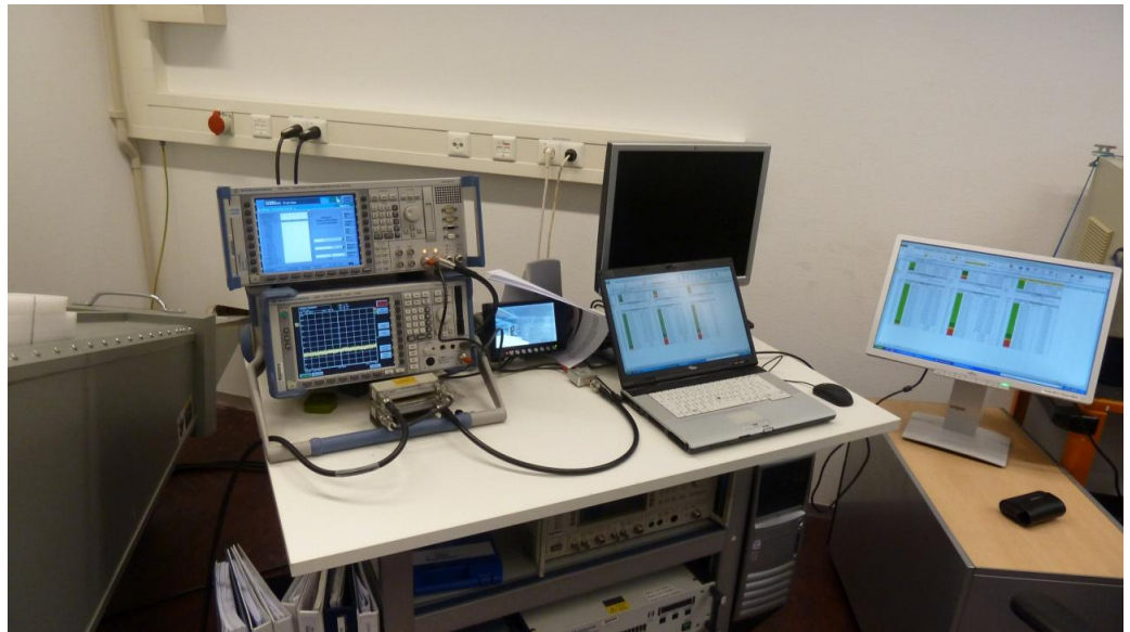
Afbeelding 5: De GSM/UMTS-base station simulator en de spectrum analyzer