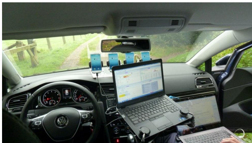
Afbeelding 3: Meetopstelling validatiemetingen

Voor de validatiemetingen (de drivetest) is gebruik gemaakt van een dienstwagen van Agentschap Telecom (personenauto, merk VW type Golf Variant). Op het dashboard zijn de vier telefoons gemonteerd die verbonden zijn met de meet- en testapparatuur waarmee elke 55 seconden een 1-1-2-oproep wordt gedaan. Speciale netwerkkapparatuur (ROMES TSMW) meet tegelijkertijd de eigenschappen van de verschillende netwerken in de ether, soort netwerk, signaalniveaus van de netwerken en eventuele netwerkkinterferentie en andere versturende factoren.